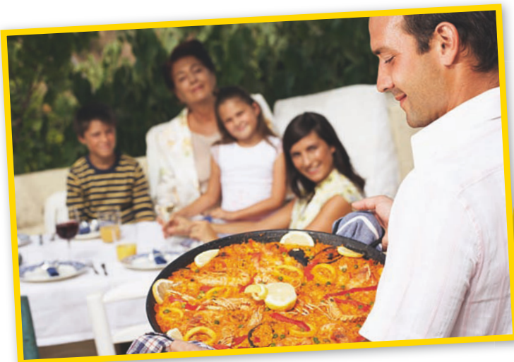
Los domingos a las 15:00, comida familiar