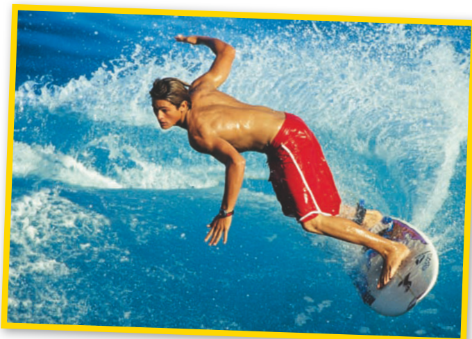
A las 17:30, surf en la playa